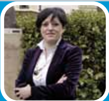
Entrevista a Sagrario Loza , Consejera de Servicios Sociales del Gobierno de La Rioja